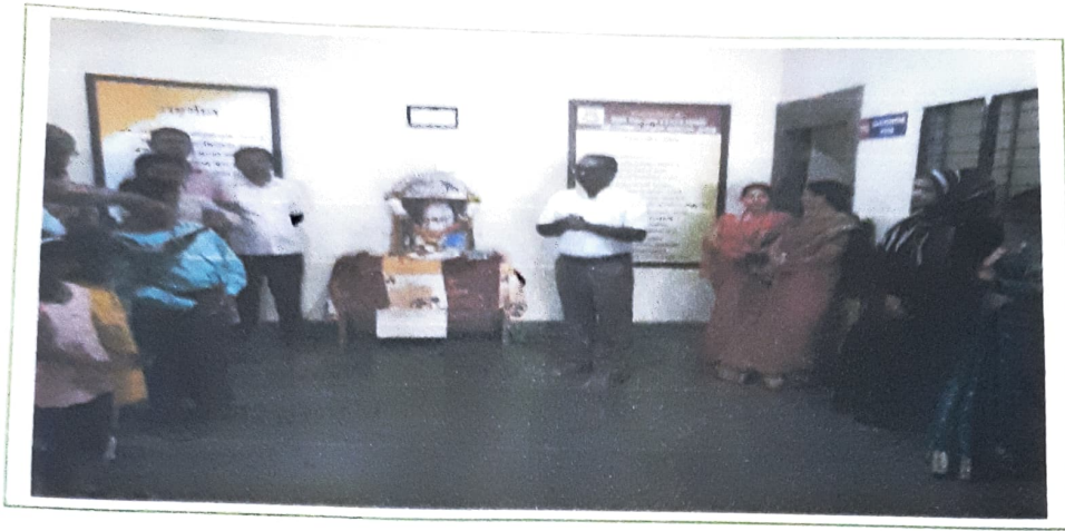
Photo of Events